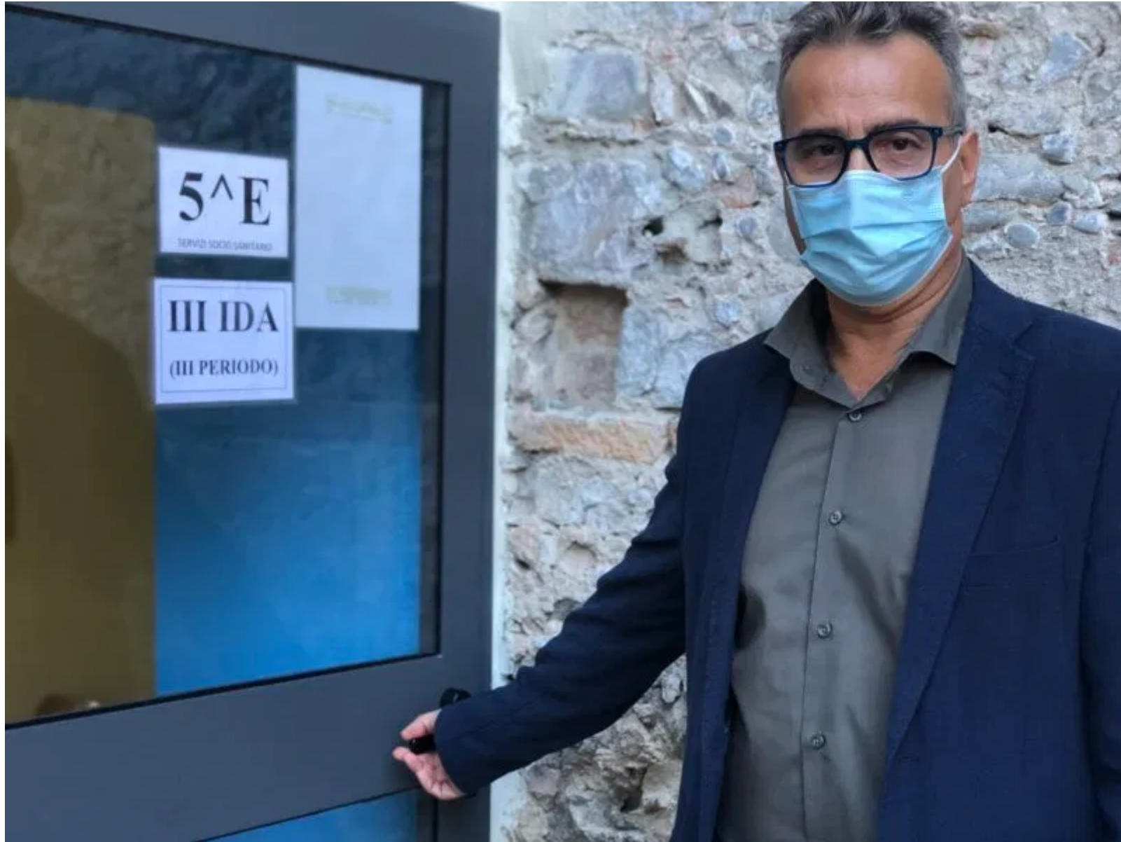
Nota Stampa n. 02/2020